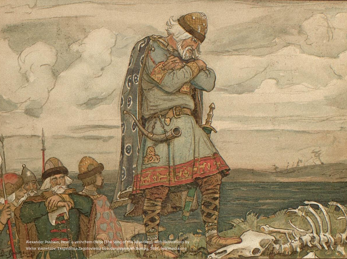
Alexander Pushkin, Pesn' o veshchem Olége [The Song of the Wise Oleg], with illustrations by Viktor Vasnetsov, Ekspeditsia Zagotovleniia Gosudarstvennykh Bumag , 1899

Colloque international | 27 au 29 mars 2025